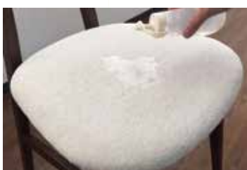
②水をたっぷり馴染ませて1分程置き、水の力で汚れを浮かせます。落とすにくい汚れは希釈した食器用中性洗剤を使います。