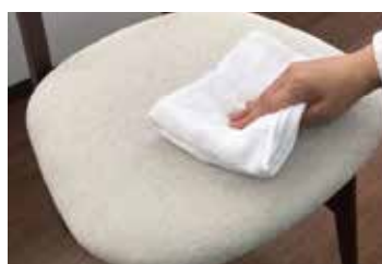
③濡れたタオルで汚れを拭き取ります。最後に汚れや洗剤を綺麗なタオルで拭き取り、良く乾かします。