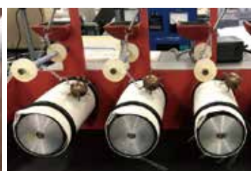
④独自基準の厳しいスナッキング試験。通常100回転で行う試験を2000回まで引き上げて確認を行いました。