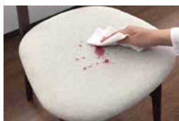
①なるべく早く汚れをティッシュやキッチンペーパーなどでしっかり拭き取ります。(洗浄後の輪ジミの原因になります。)

フォレスケアプラスは「強度の強さ」と「柔らかさ」という相反する特性を併せ持っています。水洗いもできますので、いつまでも愛着を持ってお使いいただくことができます。